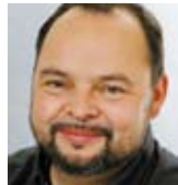
Felix Materne Biomarkt Vital, Aachen

Schrot&Korn ist für mich der Informations-Klassiker aus dem Bio-Bereich. Das neue, klare und moderne Erscheinungsbild wertet die Berichterstattung auf, bringt Magazincharakter und macht Lust auf Green Lifestyle.