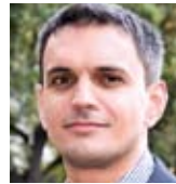
Georg Kaiser Bio Company, Berlin

Hallo liebe Redaktion, da habt Ihr Euch und uns ein feines neues Print-Produkt gebaut! Klare, helle freundliche Architektur und neue Fenster die uns allen gute Perspektiven eröffnen. Innovatives und Bewährtes optisch fein nebeneinander! Gratulation zum gelungenen Relaunch!